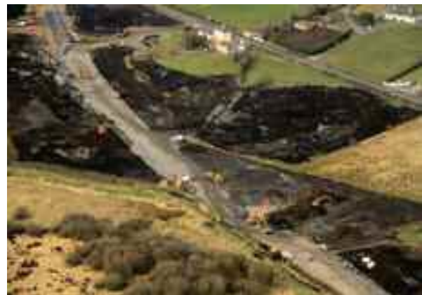
N55 Athailíniú Dundavan go Mullach Odhráin

Fuarthas maoiniú €4,600,000 don scéim seo agus bronnadh an conradh ar P. Clarke and Sons Limited mí Bealtaine, tosaíodh ar an dtógáil mí an Mheithimh 2012.