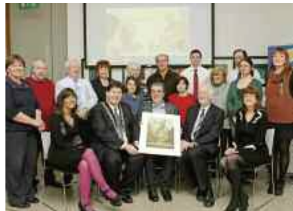
Eanáir: Seoladh www.cavanlibrary.ie agus Méáin Sóisialta

Bhí torthaí gan dabht ar ár dtiomantas don bhonneagar Teicneolaíocht an Eolais a uasdátú. Seoladh go hoifigiúil Suíomh Gréasáin agus Meán Sóisialta na Leabharlainne mí Eanáir agus faoin am san bhíothas tar éis 91 000 cuairt a thabhairt ar an suíomh, d'fhanadh a t-úsáideoir cúig nóiméad ar an meán. Ní haon ionadh gur ábhar spéise é an leathanach staidéar áitiúil. Feabhsaíodh na seirbhísí ar líne , tá Aip Leabharlann an Chabháin agus anois is féidir leabhar a athnuachan ar líne. Mí na Samhna, le tacaíocht ó na Foirne Teicneolaíocht an Eolais agus Fuinnimh, bhí Leabharlann Cheannais Mhic Sheáin ar an gcéad seirbhís leabharlainne in Éirinn a rinne uasghrádú ar an ngréasan Ríomhairí Poiblí nuair a fuarthas an réimse is déanaí PC beaga ar bhonn eiceolaíoch ar a dtugtar spóil. Dá réir sin beidh Comhairle Contae an Chabháin an-ghar don laghdú reachtúil in úsáid fuinnimh mar a bheidh 33% don bhliain 2020.