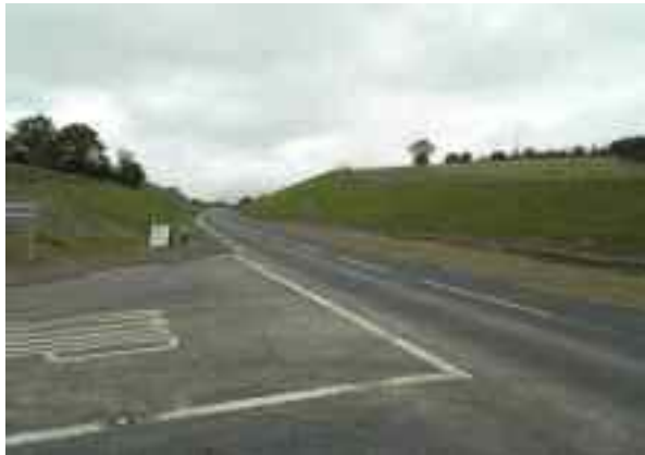
N55 Athailíniú ag Corr Dubh, Béal Atha na nEach