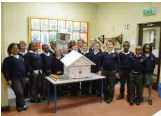
Scoláirí Scoil Náisiúnta Droim na Cille ag foghlaim faoi Bithéagsúlacht.