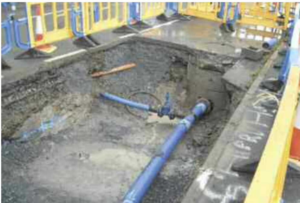
Athnuachan Príomhphíopaí Béal Átha hÉis.

Rachfar ar aghaidh chuig céim thógála na scéimeanna atá luaite thuas le linn 2013.