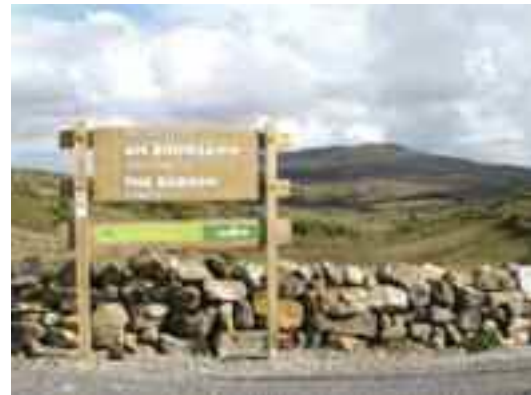
Slí isteach don Bhoireann Iasmuigh den Bhlaic

Lorg Cumann Saoire Chill na Seanrátha maoiniú um sharláthair iascaigh Fáilte Éireann chun bolscaireacht a chur chun cinn. Fuarthas €2,715 a caitheadh ar fhógraíocht, suíomh nua idirlín, painéal eolais ar an mbaile agus 5,000 cóip de bhileog nua turasóireachta.