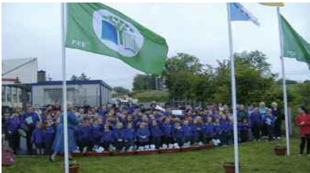
An bratach á hardú ag Scoil Náisiúnta Chrúbanach