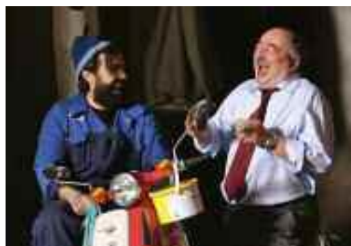
'The Nutcracker' le Ballet Ireland a thainig mí na Samhna