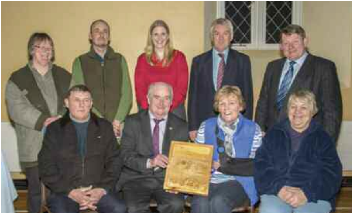
Bronnadh ar Bheistrí Tofa Chill Mhór, Buaiteoirí Gradam An Mhíle Órga 2012

Tá réimse leathan dualgas ar an Oifig Oidhreachta maidir le gnéithe éagsúla na hOidhreachta i gContae an Chabháin. San áireamh tá leachtanna, nithe seandálaíochta agus oidhreachta, oidhrecht ailtireachta, fásra, ainmhithe, gnáthóga fiadhúlra, tírdhreacha, geolaíocht, gáirdíní oidhreachta, faichí poiblí agus uiscebhealaí intíre.