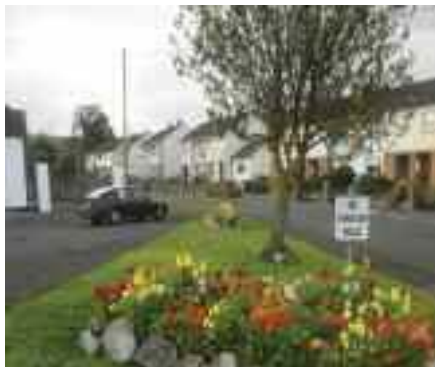
Bláthcheapacha, Doonbeg, Béal Átha Chonail