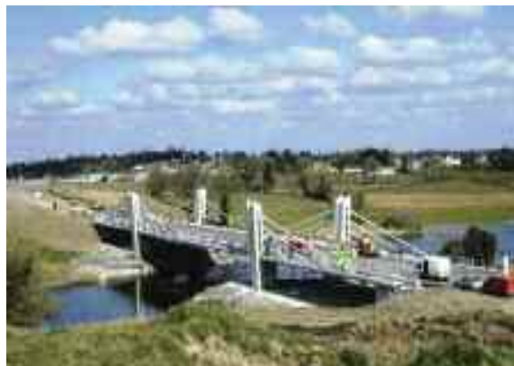
Droichead nua á thógáil thar an Éirne i mBéal Tairbirt

Maoiníodh dhá scéim cosán i 2012 ar an N3 agus N16. Tá an Scéim N3 Béal Tairbirt go Aghalane 2,550 méadar ar fhad agus an Scéim Corr an Mhathain go Kiltomulty 3,200m. Rinneadh athchoiriú in áiteanna de réir gá, neartú agus dromchla chomh maith le comharthaí tráchta agus marcáil bhóithre le súil go mairfidís 20 bliain.