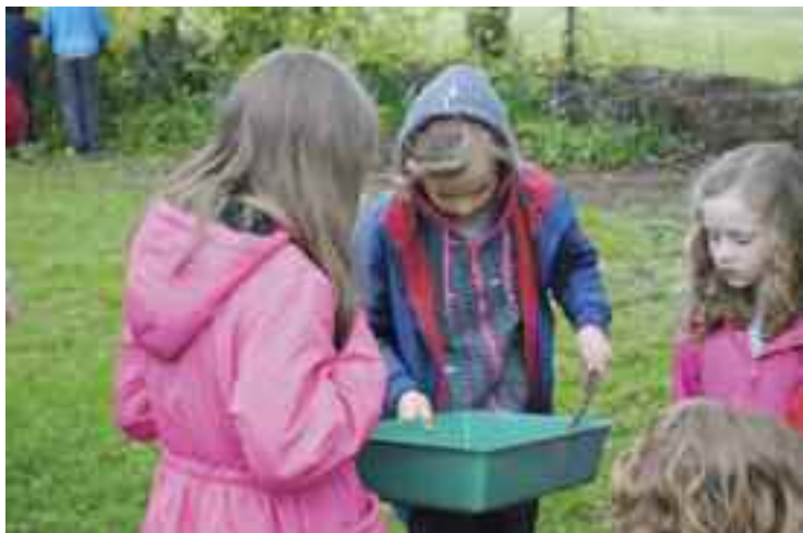
Lá Fiadhúlra i bPáirc Con Mac Gabhann le linn Fleadh 2012

Ina theannta san bíonn ról tábhachtach ag an Oifig Oidhreachta maidir le bolscaireacht ar fud an Chontae. I 2012, eagraíodh sraith imeachtaí chun meas ar an oidhreacht a chur chun cinn m.sh. Lá an Domhain, Lá Bithéagsúlachta, Lá Fiadhúlra, Imeachtaí Fleadh ar an Imeall agus an tSeachtain Oidhreachta.