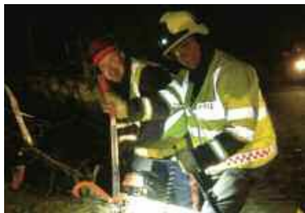
Comhraiceoirí Tine is iad ag baint crann den bhóthar i bhFearnán

I 2009 thosaigh an Stiúrthóireacht ar cháipéis náisiúnta: Treoir Chaighdeánach Oibríochta (SOG) a fhorbrófar maidir le breis is 50 saghas eachtraí. Caithfear na SOG a chur in oiriúint do riachtanais áitiúla oibríochta. Go dtí seo eisíodh 47 chinn de SOG ar bhonn náisiúnta agus tá 41 díobh siúd déanta cheana féin ag Seirbhís Dóiteáin an Chabháin. Tá sé i gceist ag an Stiúrthóireacht Náisiúnta na cinn eile a fhorbairt agus a eisiúint le linn 2013. Éilítear breis oibre ón Seirbhís Dóiteáin mar gheall ar an dTreoir Chaighdeánach Oibríochta mar caithfear acmhainní a fháil d'oiliúint is do chleachtadh chomh maith le fearas nua.