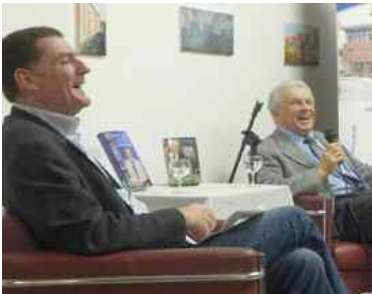
Mí na Nollag: An Laoch Spóirt John Giles ag baint sult as lucht éisteachta an Chabháin i Leabharlann Cheannais Mhic Sheáin