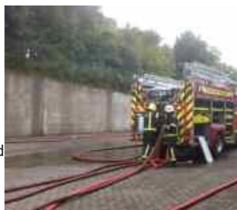
Cúrsa Caidéalaithe 2012

I 2012 eagraíodh cúrsaí oiliúna in iompar dóiteáin, tiomáint, céadfhreagairt, timpistí bóthair, feasacht uisce, oibriú sábh slabhra, goireas anála (athnuachan agus bunoiiliúint), comhrac dóiteáin d'earcaithe agus láimhseáil. Bíonn oiliúint rialta 2.25 uair a chloig trí oíche in aghaidh na seachtaine do gach briogáid freisin. Téann oifigigh idir Shóisir agus Sinsir ar chursaí de chuid na Stiúrthóireacht Náisiúnta mar is cuí. Éilítear breis oibre ón Seirbhís Dóiteáin mar gheall ar an dTreoir Chaighdeánach Oibríochta maidir le hacmhainní a fháil d'oiliúint is do chleachtadh do Chomhraiceoirí Tine.