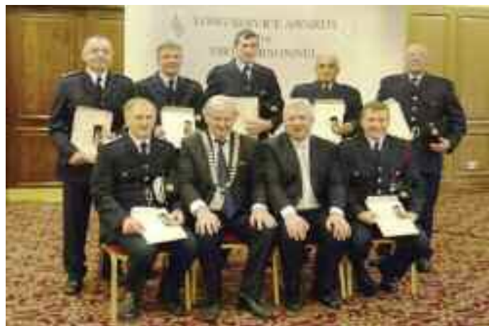
Gradaim Fhadshairbhíse 2012

Cheadaigh an Roinn Comhshaoil, Pobail agus Rialtais Áitiúil cuntais deiridh Stáisiún Dóiteáin Muinchille agus Béal Tairbirt; íocadh €41,116 agus €51,857 chucuan faoi seach. Tá suímh ar fáil do dhá stáisiún nua i mBaile Shéamais Dhuibh agus Achadh an Iúir. Tá na cáipéisí conartha do Stáisiún Achadh an Iúir ag an Roinn faoi láthair sula ndéantar tairiscint. Tharla comhráití maidir le Stáisiún Dóiteáin Bhaile Shéamais Dhuibh. Níor dáileadh aon mhaoiniú d'fhearais dóiteáin i gClár Caipitiúil 2012.