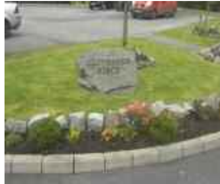
Bláthcheapacha, Plás Clonmahon, Béal Átha na nEach