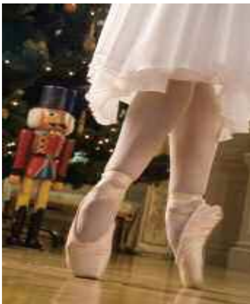
'Tom Crean Antarctic Explorer'