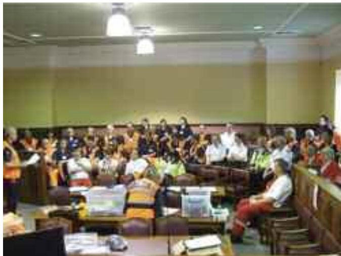
Coimriú Saorálach don bhFleadh Cheoil 2012