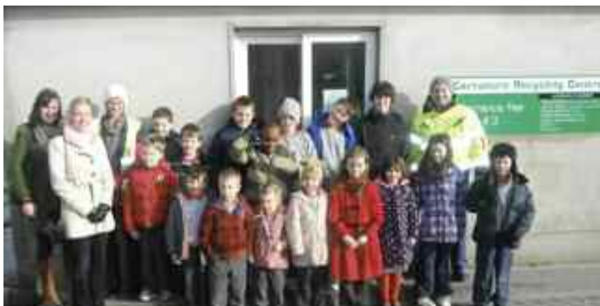
SN Fhearnáin An Cabhán ar cuairt staidéir chuig Láithreán Dramhaíola agus Athchúrsála McElvaney i gCorr an Iúir