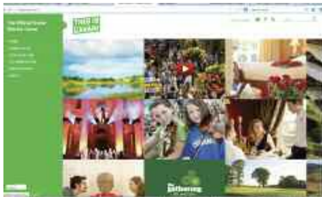
Suíomh Idirlín Seo é An Cabhán!

Branda Nua An Chabháin Forbraíodh branda nua 'Seo é An Cabhán!' tar éis comhairliúchán cuimsitheach le páirtithe leasmhara sa chontae. Ba iad Martin Gaffney Design a mhaoirsigh an branda chun turasóireacht agus fiontar a chur chun cinn sa chontae. Cruthaíodh suíomh nua idirlín, cuntais Facebook agus Twitter san áireamh agus foilsíodh bróisiúr nua. Ba é An Taoiseach Enda Kenny a sheol an branda sa Chabhán mí Deireadh Fómhair.