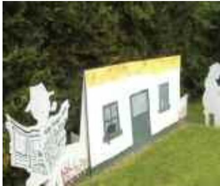
Ealaíon Sráide, New Line, Muinchille