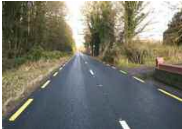
Uachtar idir Droim Chaiside agus Caonaigh