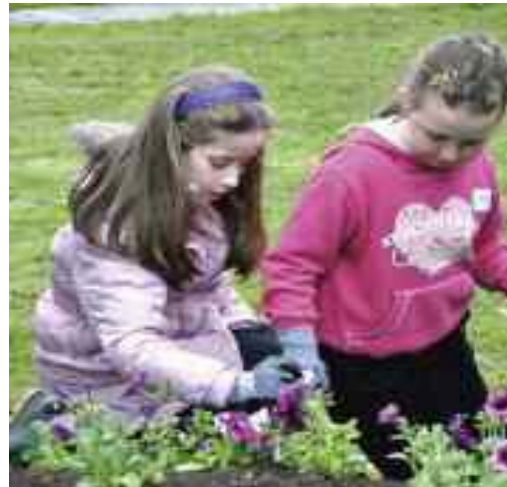
Leanaí ag obair ar an nGáirdín Síochána

Cé go bhfuil an geilleagar go fíordheacair faoi láthair leathnaigh an Músaem a chuid gníomhaíochtaí i ngach aon slí. Leanadh den tionscnamh trasteorann “Nascadh Daoine, Áiteanna agus Oidhreacht” nuair a forbraíodh Gáirdín Síochána i ngáirdín mór na Leabharlainne. Tháinig an maoiniú chuige sin ó Shíocháin agus grupaí ó Thuaidh is ó Dheas ag saothrú le cheile chun gáirdín álainn inrochtana a chruthú do chuirteoirí. San áireamh tá raonta dúlra a thugann deis dóibh an timpeallacht nádúrtha a fhiosrú trí theagmháil, blas agus boladh..