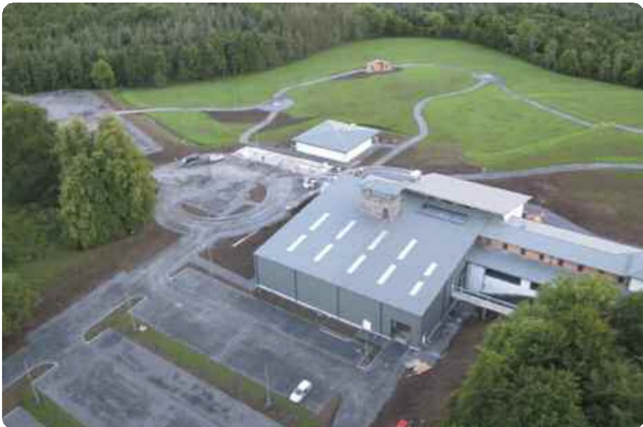
Ionad Idirnáisiúnta Gasóga Caisleán Sandarsan

Ba é an tUachtarán Mícheál D Ó hUiginn a d’oscail an áis úd go hoifigiúil 18 Lúnasa 2012. Tá Caisleán Sandarsan anois ainmnithe ar na cúig Ionad Gasóga um Shíocháin Domhanda. Beidh ról lárnach ag an ionad maidir le forbairt an ógra a leathnú trí mheas agus tuiscint acu ar a chéile.