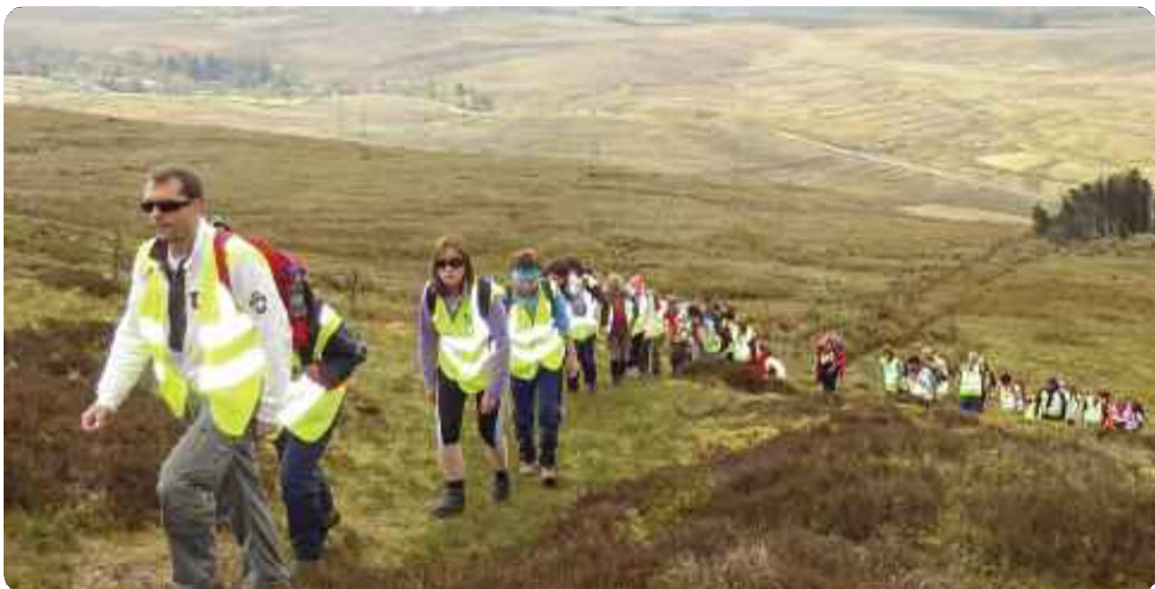
Ag dreapadh ar Chuilceach le linn Feile Siúlóide an Chabháin