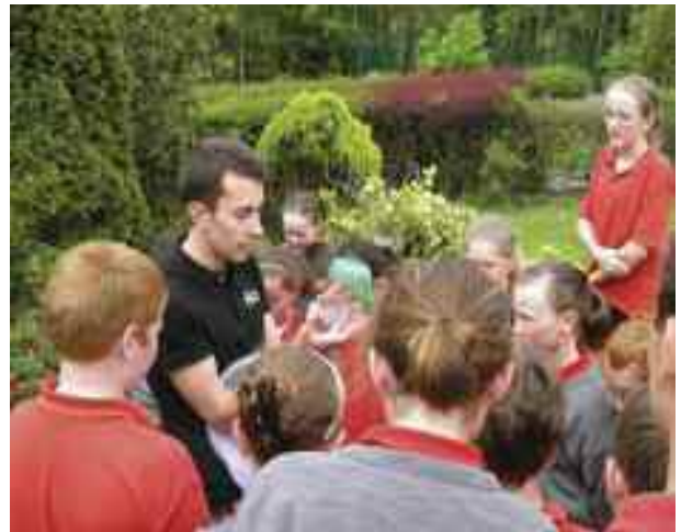
Scoláirí Scoil Náisiúnta Droim na Cille ag foghlaim faoi Bithéagsúlacht.