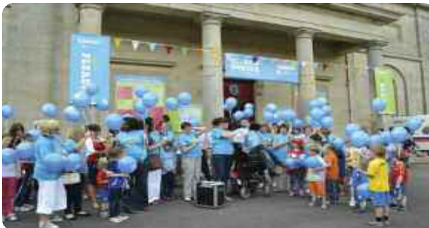
Lá Inrochtaineachta le linn Fleadh 2012

Tugadh cuireadh do ranganna idirbhliana sa chontae a bheith páirteach sa mhódúil spreagúil nua úd a bunaíodh chun cur le feasacht na mac léinn um cheisteanna lucht míchumais. Bíonn dhá mhír sa mhódúil, ceann amháin is ea móduil e-fhoghlama a léiríonn feasacht